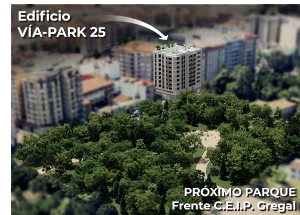
Edificio VÍA-PARK 25